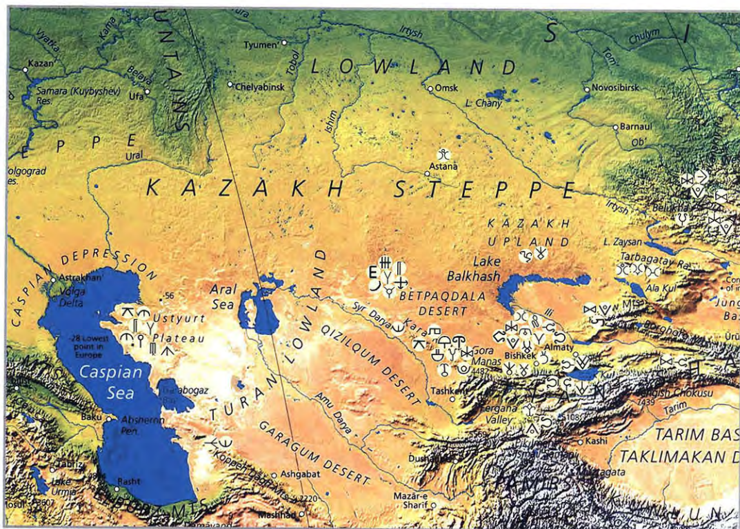
Илл. 1. Карта-схема распространения основных типов тамг-петроглифов